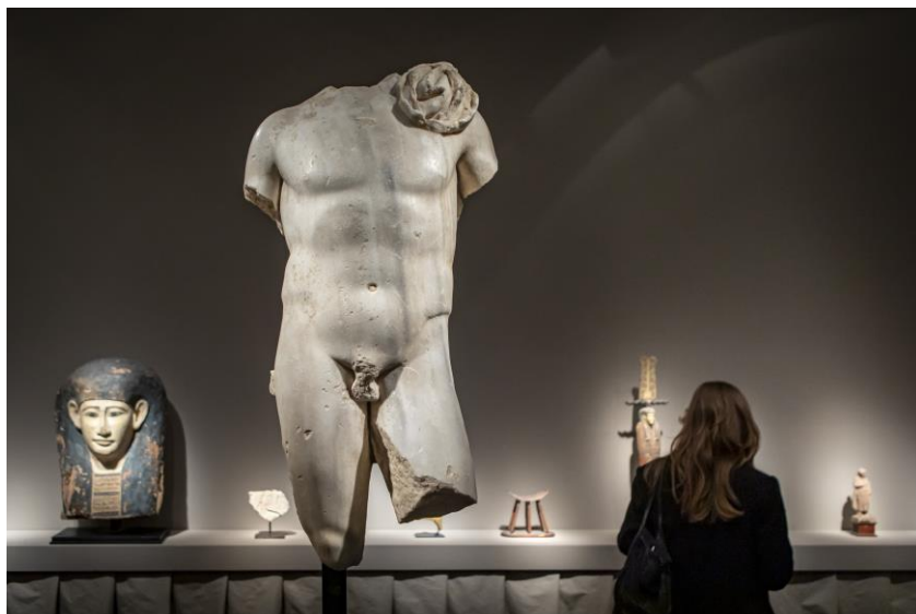
Fine Arts Paris

Après un lancement réussi en 2020, FINE ARTS PARIS ONLINE viendra renforcer l'interactivité entre les marchands et les clients qui ne pourront pas se déplacer.